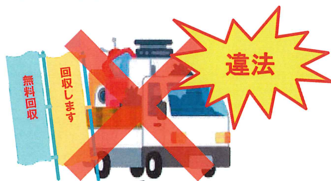
解体業者、不用品回収業者等（一般廃棄物処理業の許可なし）が回収