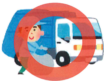
市町村の指定する方法